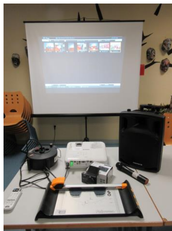
Matériel pour LUNEVILLE

Merci à tous nos généreux donateurs qui nous ont permis d'attribuer ces prix destinés à mettre en valeur et à soutenir l'activité solidaire de ces Associations.