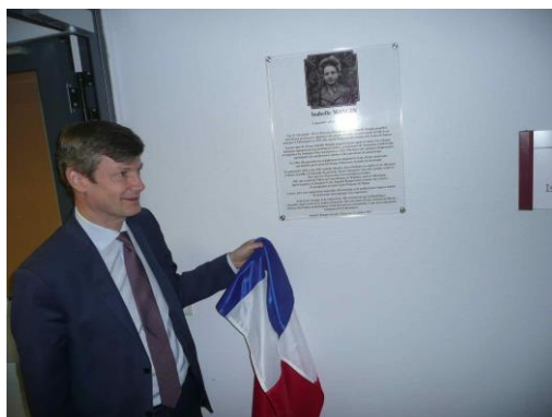
Monsieur le Préfet dévoile la plaque

Un hommage bien mérité à une femme d'exception.