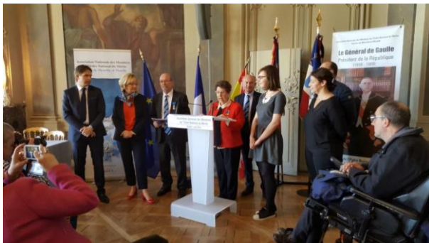
Prix du civisme pour la jeunesse