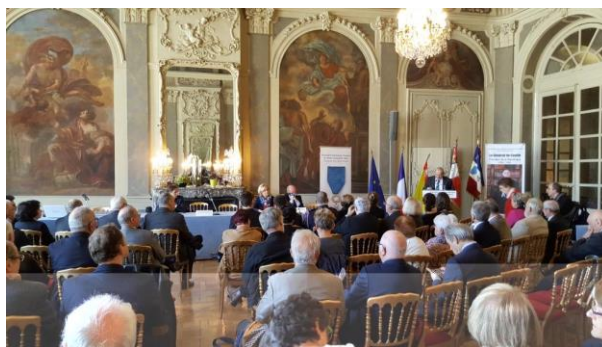
L'assistance attentive lors de l'A.G.

Faisons connaître les valeurs de l'Ordre du Mérite : promouvoir les valeurs morales, civiques, d'honneur, par toutes les actions éducatives et de mémoire, de solidarité et d'entraide.