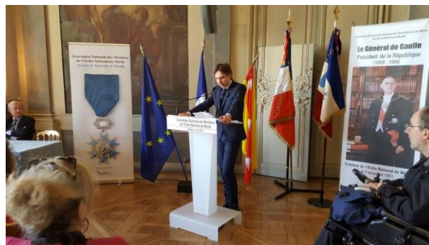
Allocution du Directeur de Cabinet de Monsieur le Préfet