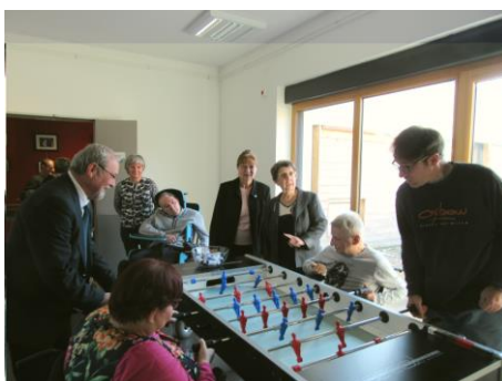
Partie de babyfoot acharnée