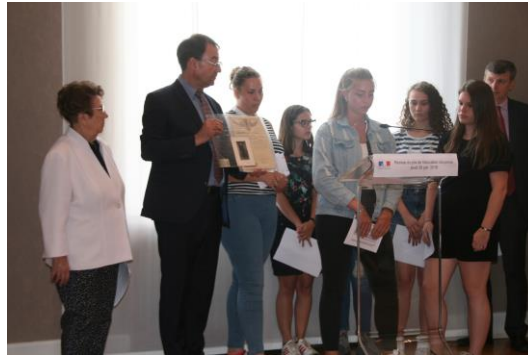
La classe primée au concours nationale ONM