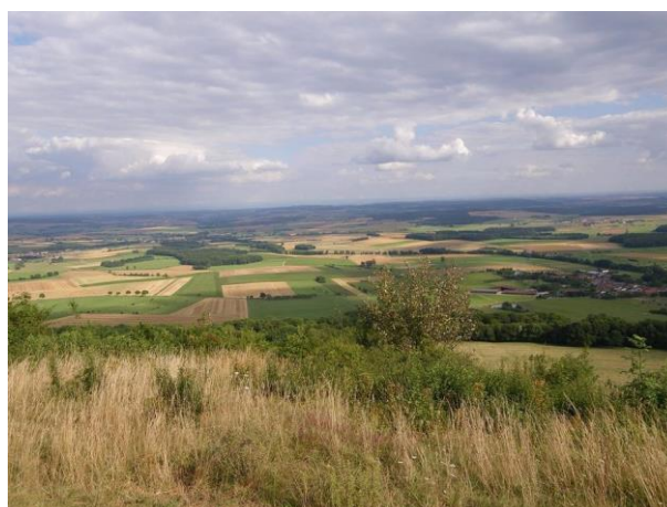
Vue du paysage depuis la colline de SION