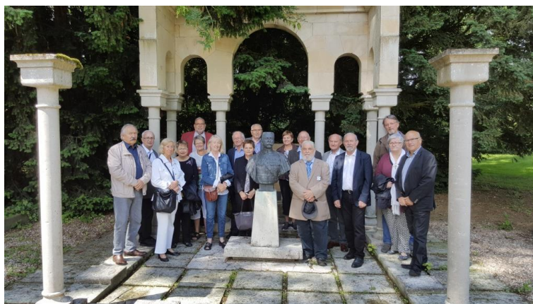
Devant la statue du Maréchal LYAUTEY