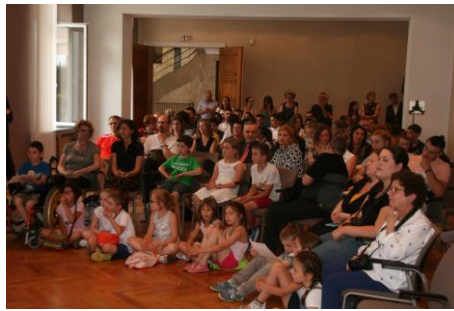
Les élèves attentifs