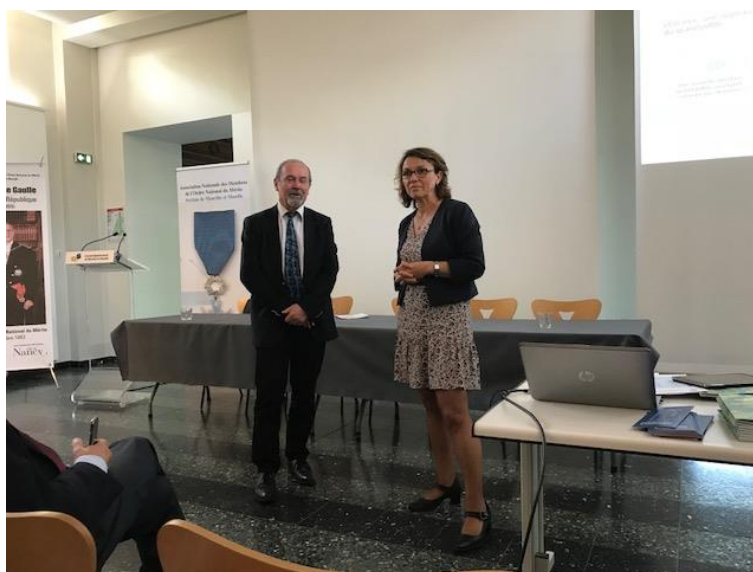
Le Président accueille Madame BERTIN

Nucléaire : 74,1% - Thermique : 11,6% - Hydraulique : 7,7% - Éolien : 5,4% - Solaire : 0,5% - Bioénergies : 0,6%