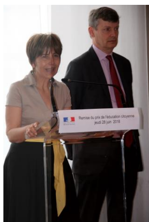
Monsieur le Préfet et Madame l'Inspectrice

Un délicieux goûter, servi dans le parc de la Préfecture, termina cette belle réception.