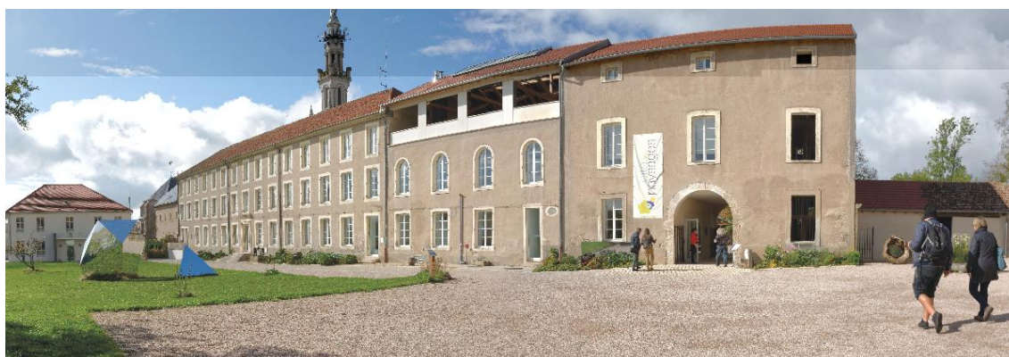
Le couvent rénové de SION